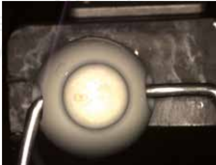
Prüfung auf Anwesenheit des Dichtgummis.